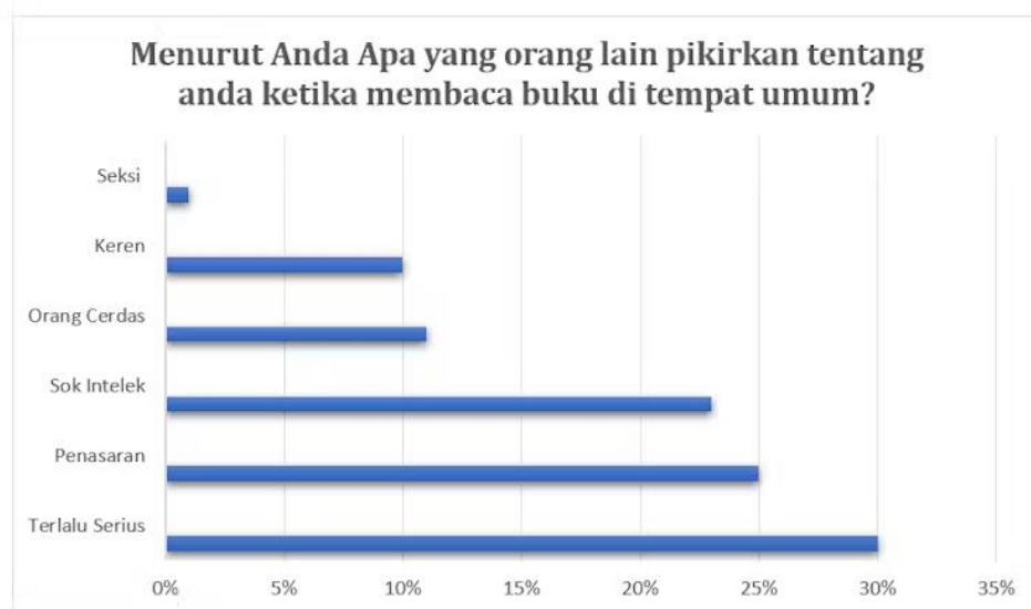
Gambar 2. Persepsi Membaca di tempat umum.