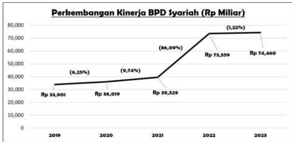
Gambar 1.1 Perkembangan Kinerja BPD Syariah